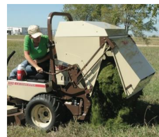
PowerVac™ koguja M16 (450 L)

Tahaväljavise (4X Dedicated Rear Discharge™). Suurepärase lõikejälga pikemas heinas. Lõikeorganiga pääseb mõlemalt poolt takistuste lähedale. Head kasutuskohad on näiteks tee äärsed, parklate ja surnuaedade muruplatsid.